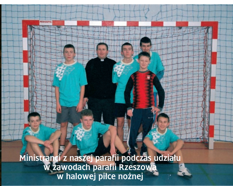
Ministranci z naszej parafii podczas udziału w zawodach parafii Rzeszowa w halowej piłce nożnej