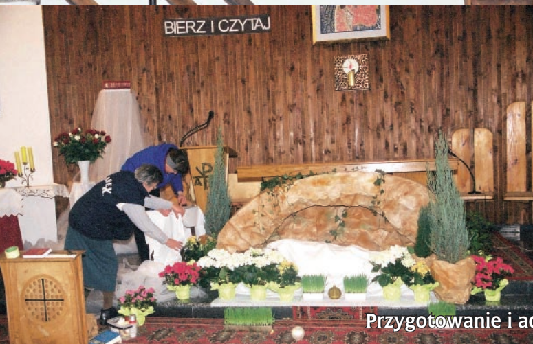
Przygotowanie i adoracja Grobu Bożego