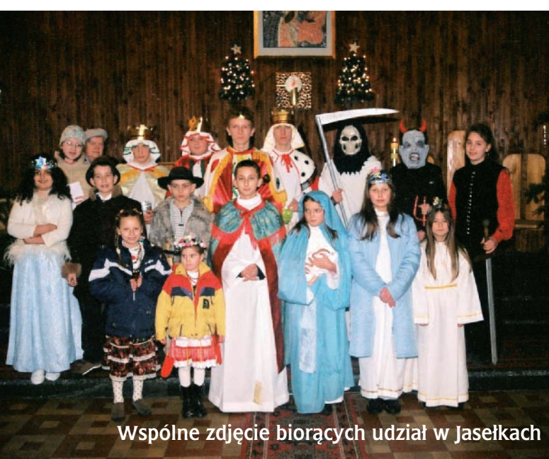
Wspólne zdjęcie biorących udział w Jasełkach