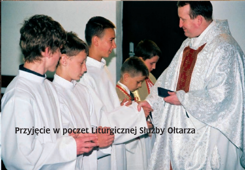
Przyjęcie w poczet Liturgicznej Służby Ołtarza