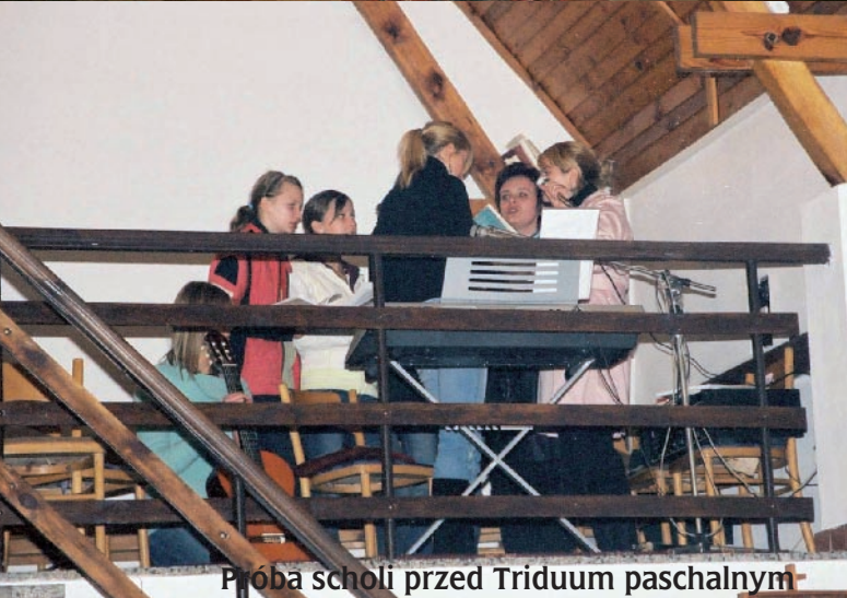
Próba scholi przed Triduum paschalnym