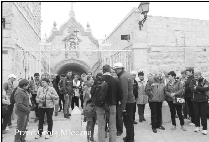
Przed Grocią Mleczną

i błogosławieństwo dla swoich dzieci za wstawiennictwem Maryi. W Grocie Mlecznej uczestniczymy we Mszy Świętej. Następnie udajemy się do Bazyliki Narodzenia Pańskiego, która z zewnątrz przypomina twierdzę.