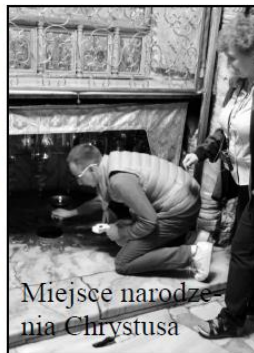
Miejsce narodzenia Chrystusa

rym Jezus został złożony po narodzinach. Zwiedzanie kończymy w kościele Św. Katarzyny Aleksandryjskiej. Jest to rzymskokatolicki kościół parafialny w Betlejem sąsiadujący z Bazyliką Narodzenia Pańskiego. Świątynię wzniesli franciszkanie i kościół znajduje się na terenie klasztoru. W podziemiach z wiedzamy jeszcze Grotę Św. Józefa, Grotę Św. Hieronima oraz Grotę Pomocnicę Św. Hieronima – Pauli i Eustachii.