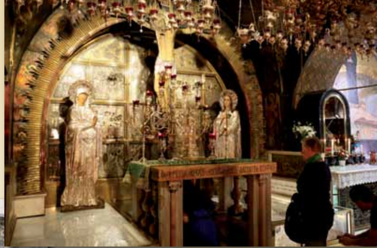
Golgota – miejsce ukrzyżowania Chrystusa