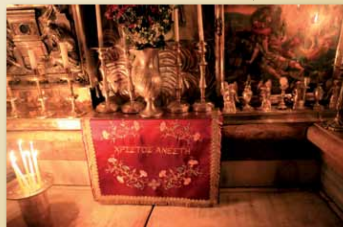
Pusty Grób Jezusa