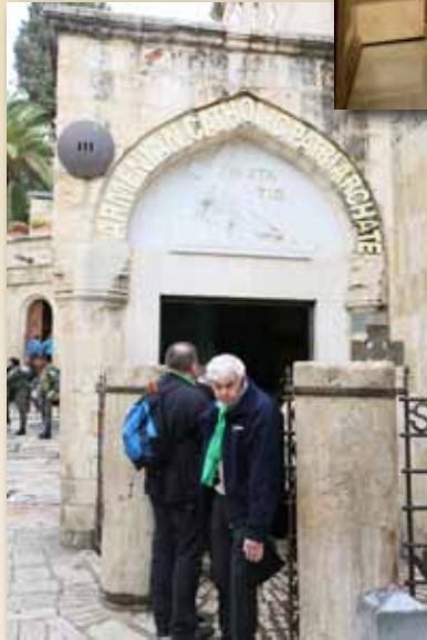
Przy III „polskiej” stacji