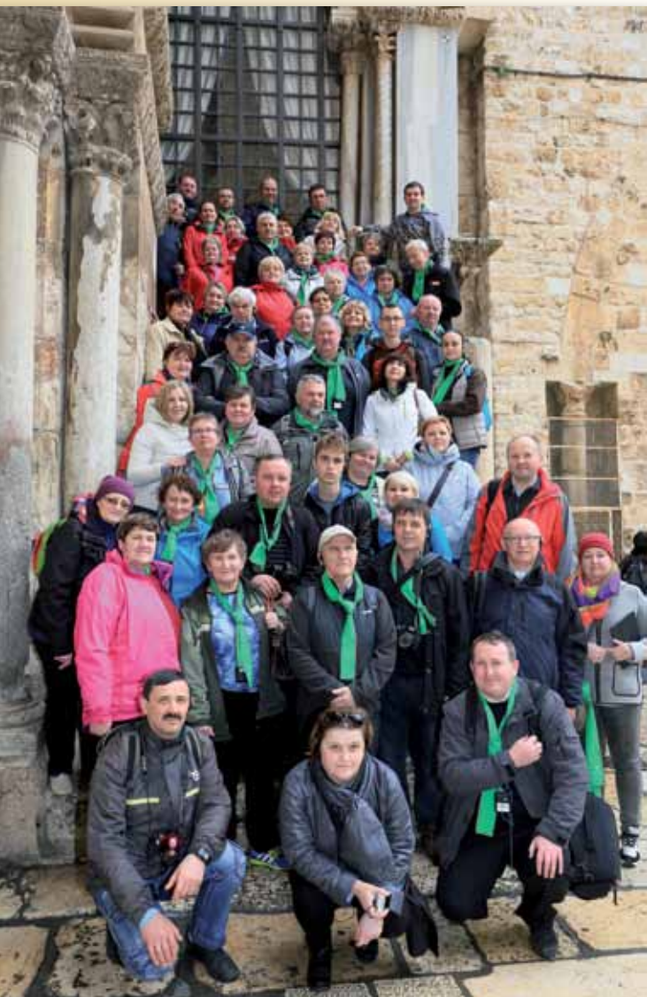
Wspólne zdjęcie przed Bazyliką Grobu