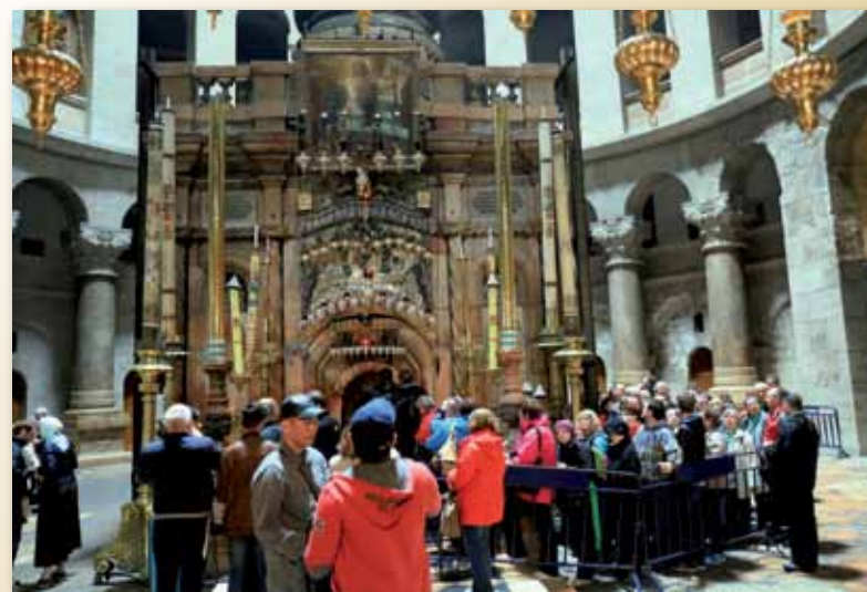
W kolejce do Grobu