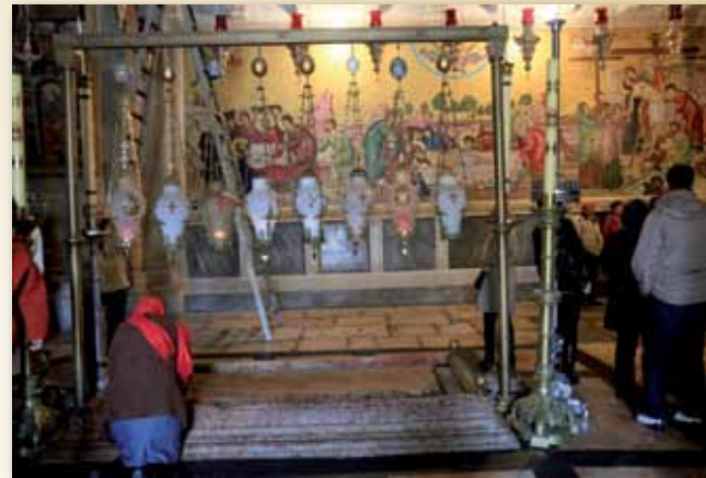
Miejsce namaszczenia Pana