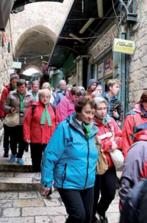
Na Drodze Krzyżowej