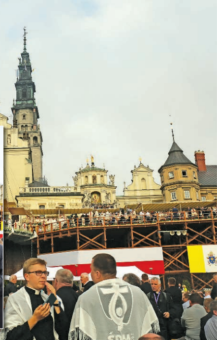
Częstochowa 28.07 - poświęcenie kamienia węgielnego przez papieża Franciszka