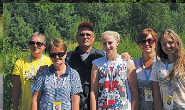
Piesza pielgrzymka Rzeszów-Jasna Góra