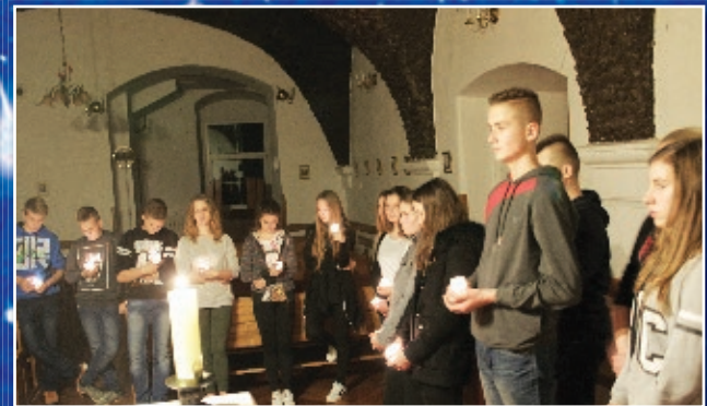
Duchowy weekend w Jarosławiu