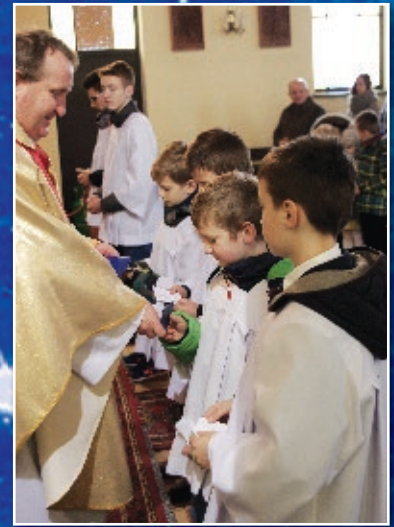
Przyjęcie do grona ministrantów