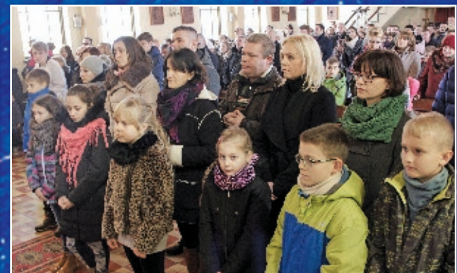
Poświęcenie medalików dla dzieci