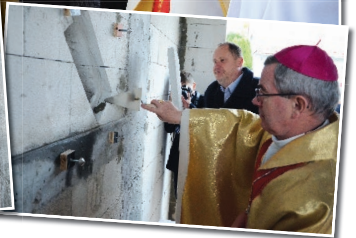
Uroczystość Wmurowania Kamienia Węgielnego 6.11.2016 r.