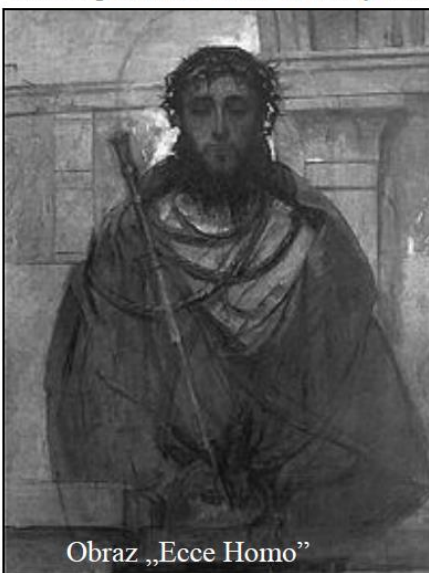
Obraz „Ecce Homo”

Brat Albert zmarł w opinii świętości w Krakowie 25 grudnia 1916. Relikwie Św. znajdują się w krakowskim Sanktuarium Ecce Homo. W całej Polsce działają Towarzystwa Św. Brata Alberta niosące pomoc naszym braciom w potrzebie. Takie Towarzystwo