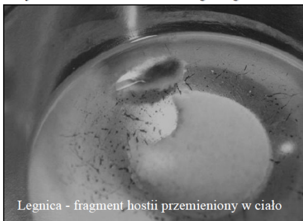
Legnica - fragment hostii przemieniony w ciało

cy. Przypomnijmy, 25 grudnia 2013 roku podczas komunii, jedna z konsekrowanych hostii upadła na posadzkę. Po włożeniu jej do wody w celu rozpuszczenia, na fragmencie pojawiło się czerwone przebarwienie - było to 4 stycznia. Po 14 dniach biała część Hostii rozpuściła się w wodzie. Została tylko jej przebarwiona część, która wyglądała jak skrzep o wymiarach 1,5 x 0,5 cm. Wyjęto go z wody, położono na korporale i schowano do tabernakulum.