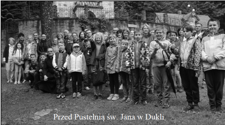
Przed Pustelnią św. Jana w Dukli

Kolejnym punktem naszego pielgrzymowania był Dębowiec. W drodze