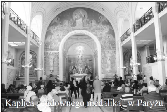
Kaplica „cudownego medalika” w Paryżu

niepozomą bramą znajduje się klasztor Sióstr Szarytek z Kaplicą Cudownego Medalika. To tutaj mogliśmy uczestniczyć we Mszy św. W przeźroczystym relikwiarzu znajdują się doskonale zachowane dośczesne szczątki św. Katarzyny. W tej kaplicy w nocy 19 lipca 1830 r. Katarzynie Laboure ukazuje się anioł. Mówił ono „Święta Dziewico cię oczekuje”. Katarzyna została zaprowadzona do kaplicy i tam w czasie modlitwy usłyszała szelest szat. Matka Boża zeszła i usiadła na krześle przy obrazie Św. Józefa. Z wyrazem