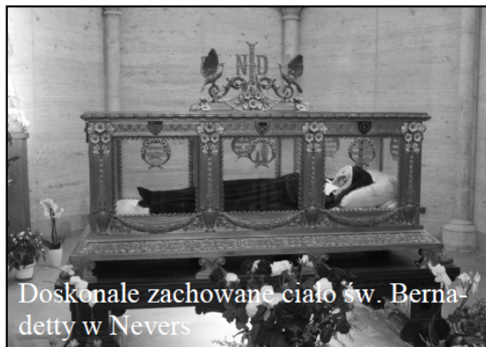
Doskonale zachowane ciało św. Bernadetty w Nevers

Zwraca się z poleceniem wybicia medalika w tej postaci i noszenia go oraz modlitwę. „Cudowny Medalik” noszony