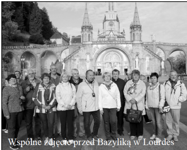
Wspólne zdjęcie przed Bazyliką w Lourdes

W dniu następnym na poranną Mszę św. zostaliśmy zaproszeni do Domu Polskiej Misji Katolickiej, gdzie posługują Siostry Nazaretanki. Z położonego na wzgórzu domu rozciąga się przepiękna panorama Pirenejów i widok na Bazylikę. Wy ruszyliśmy w dro-