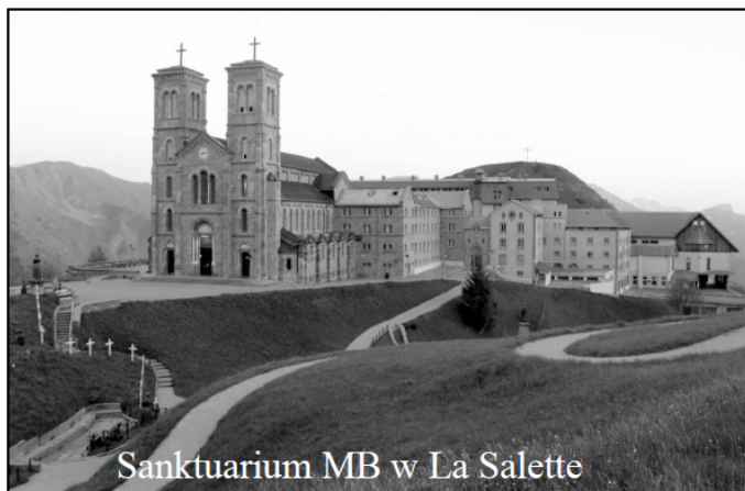
Sanktuarium MB w La Salette

La Salette leży na wysokości 1800 m., a szczyty na horyzoncie sięgają 3000 m. Ostatni 15-kilometrowy odcinek alpejskiej drogi wije się wąską serpentyną. Piękna Pani ukazała się pastuszkom - Melanii i Maksymowi 19 września 1846 r. tylko raz. Widzenie trwa ok. pół godziny. Przerazone dzieci ujrzały najpierw bardzo jasną kulę światła. Po czym ze światła wyłoniła się postać siedzącej kobiety, z łokciami opartymi na kolnierzach i twarzą ukrytą w dłoniach. Po chwili kobieta wstaje. Dzieci widzą ją w blasku światła pochodzącego z wielkiego krzyża zawieszzonego na piersiach. Na głowie również jaśniejący diadem, była ubrana w wieśniaczy strój, ramiona obciążone wielkim złotym łańcuchem, obok niego wieniec z kolorowych róż, na